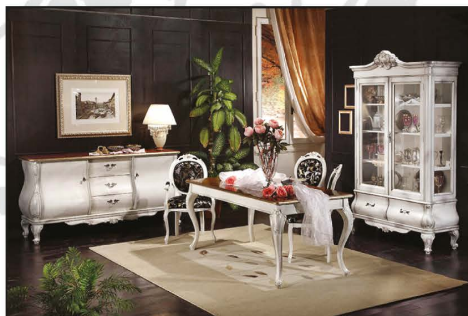
SALA DA PRANZO CON LACCATURA INVECCHIATA