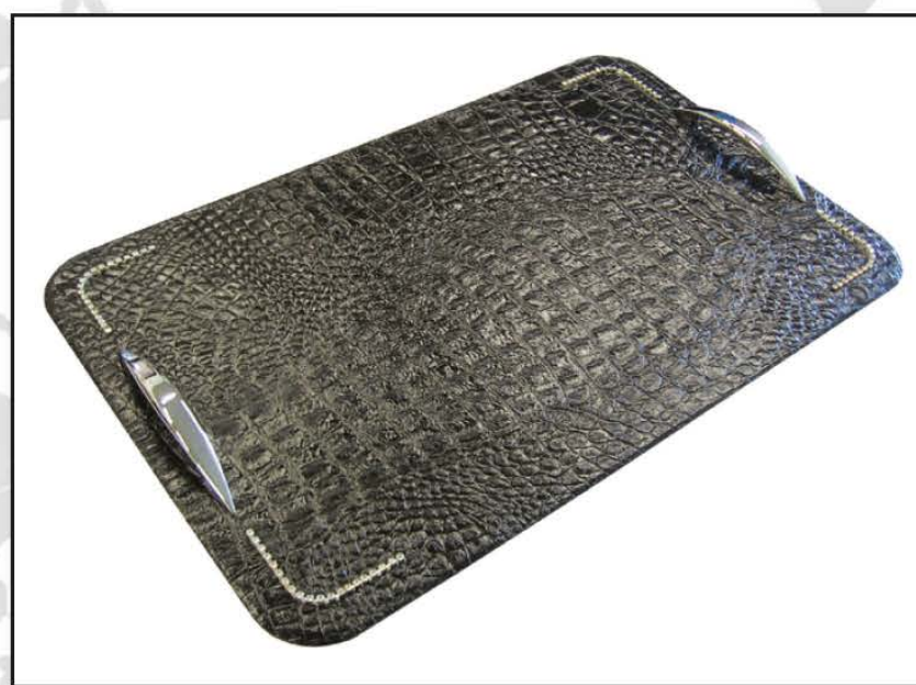
VASSOIO RIVESTITO IN PELLE CON APPLICAZIONI DI CATENA SWAROVSKI