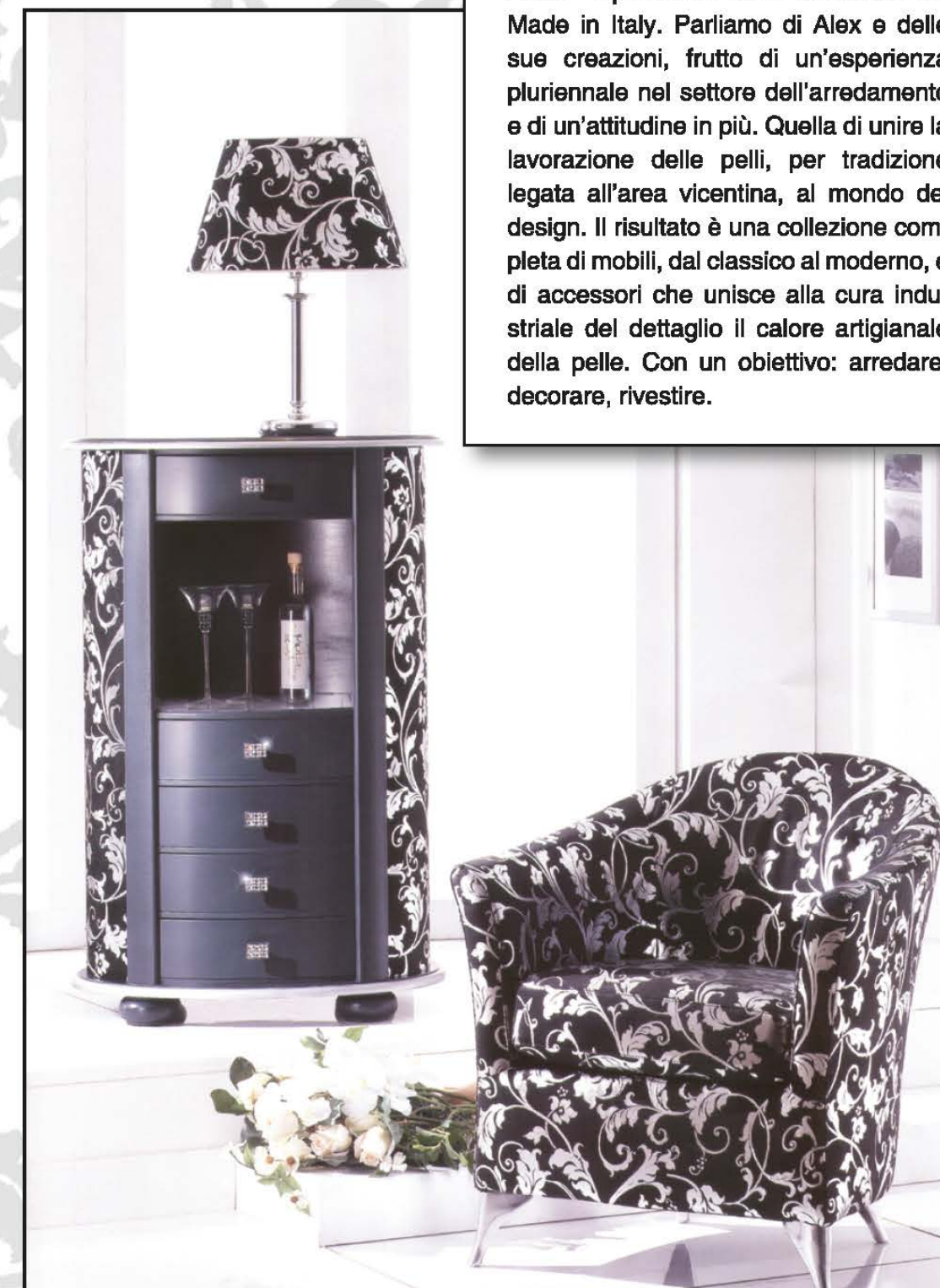
POLTRONA CATERINA, MOBILE BAR CON FIANCHI IN PELLE E MANIGLIE SWAROVSKI

Gli arredi di design cambiano veste, declinati in una serie infinita di decori e di forme espressione della creatività del Made in Italy. Parliamo di Alex e delle sue creazioni, frutto di un’esperienza pluriennale nel settore dell’arredamento e di un’attitudine in più. Quella di unire la lavorazione delle pelli, per tradizione legata all’area vicentina, al mondo del design. Il risultato è una collezione completa di mobili, dal classico al moderno, e di accessori che unisce alla cura industriale del dettaglio il calore artigianale della pelle. Con un obiettivo: arredare, decorare, rivestire.